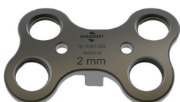
PEDUS-O WS Open Wedge Platte